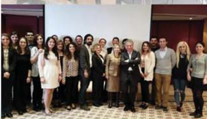
Türk Pediatri Kurumu

bu emeğin karşılık bulması bizleri çok sevindirdi. Siz meslektaşlarımıza bizlere inanıp desteklediğiniz için sonsuz teşekkürlerimizi sunarız.